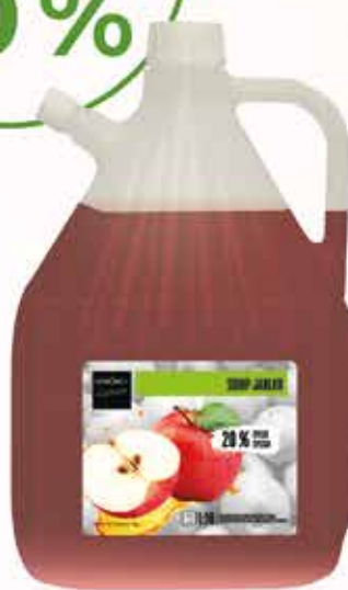
640058 JABLKO 3 L