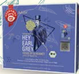
HEY EARL GREY 613451 20x4g