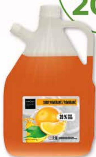
640057 POMERANČ 3 L