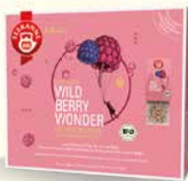
WILD BERRY WONDER 613453 20x5,5g