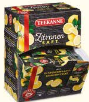
CITRONOVÁ ŠŤÁVA 640025 100x4ml