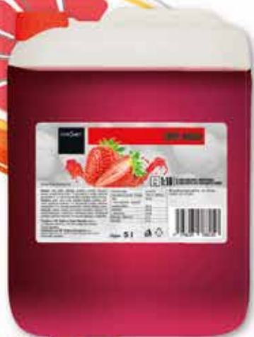
640053 JAHODA 5 L