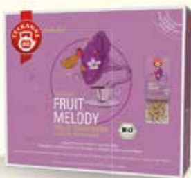
FRUIT MELODY 613454 20x5,5g