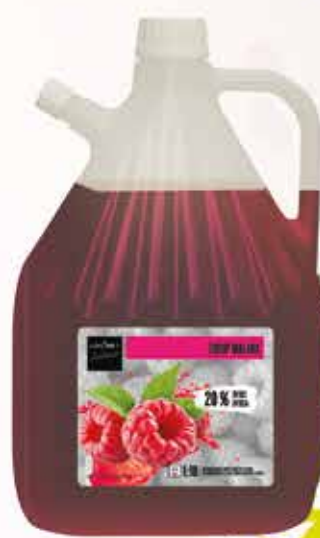
640059 MALINA 3 L