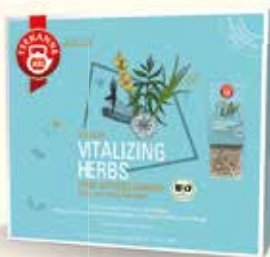
VITALIZING HERBS 613456 20x3g