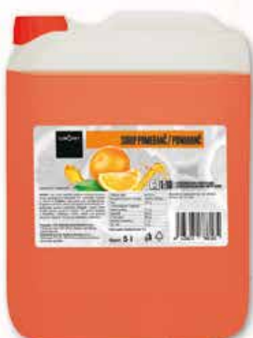
640051 POMERANČ 5 L