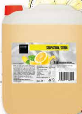
640055 CITRON 5 L