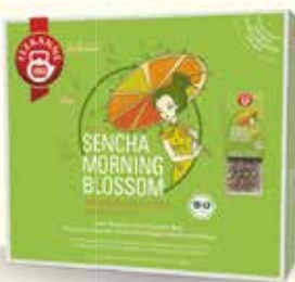
SENCHA MORNING BLOSSOM 613452 20x4g