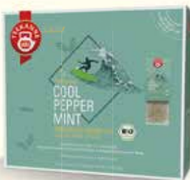
COOL PEPPERMINT 613455 20x2,5g